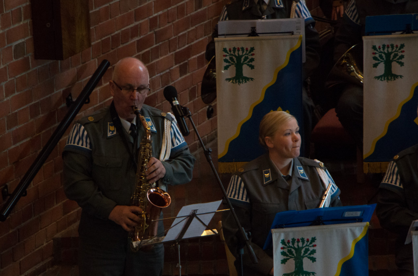
Dragsvikin perinnesoittokunta esiintyi 17.4. Merikap- pelissa