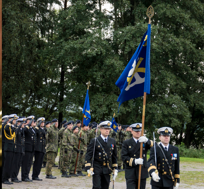
Prikaatin perinneypäivää vietettiin 30.8. Upinniemessä