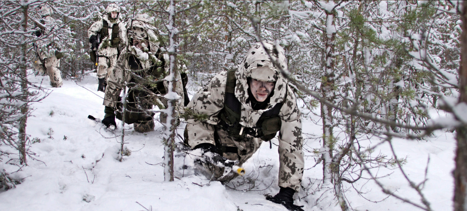
1/16 saapumiserän peruskoulutuskauden kohokohtina sotilasvala, sekä alokasleiri Kiikalan lumisissa maastoissa