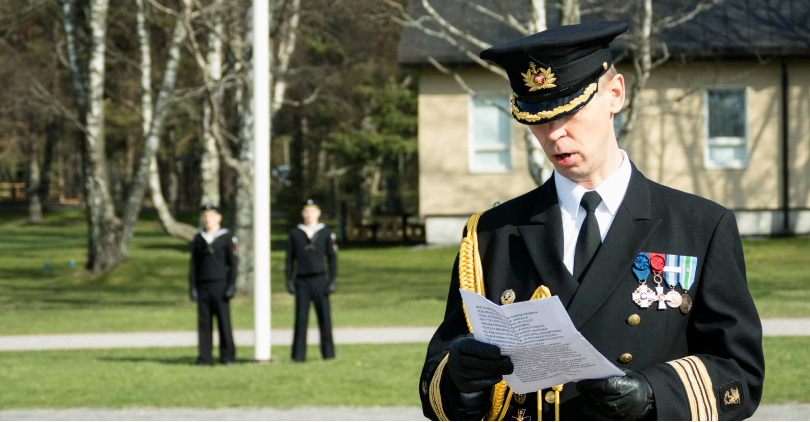
Meritiedustelupataljoona vietti perinneypäivää 29.4. Upinniessä