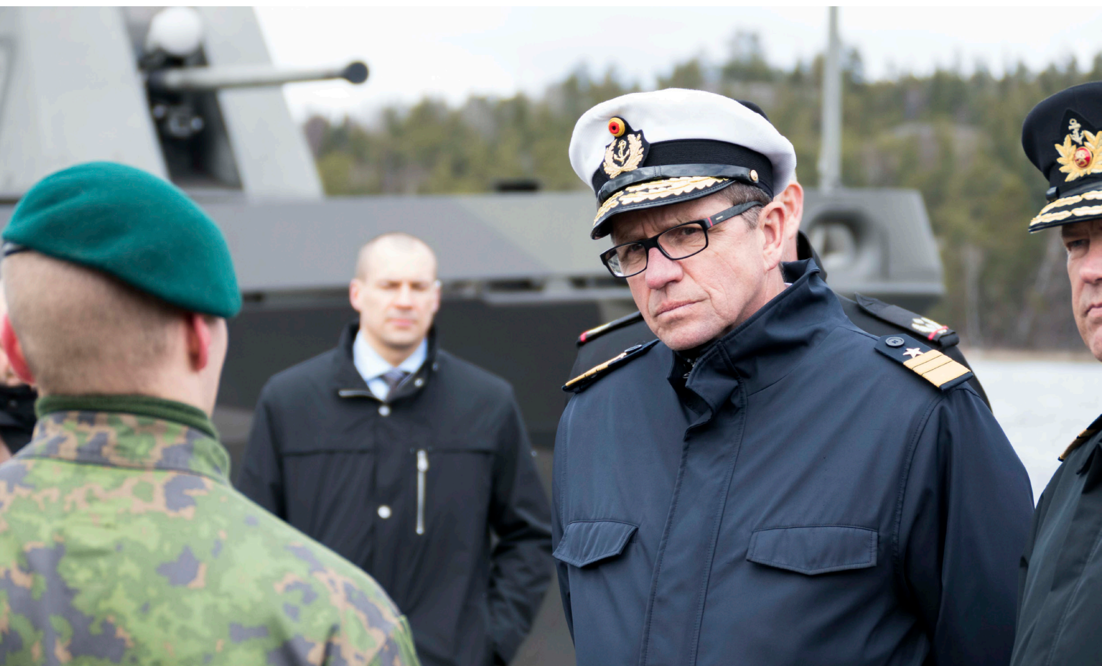
Saksan merivoimien komentaja vieraili 20.4. Upinniemessä