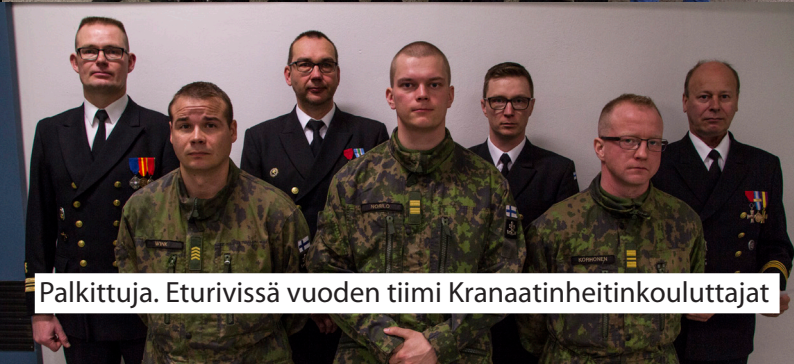
Palkittuja. Eturivissä vuoden tiimi Kranaatinheitinkouluttajat