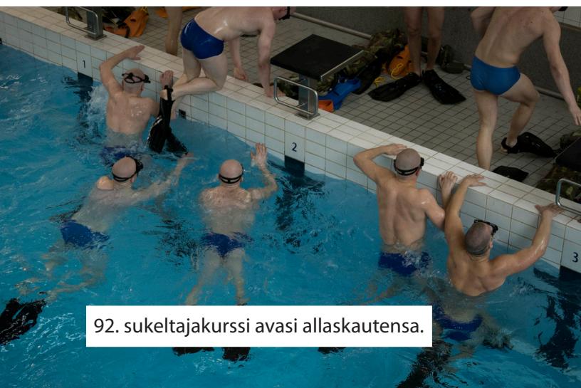
92. sukeltajakurssi avasi allaskautensa.