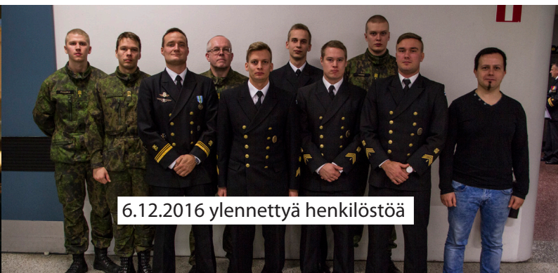
6.12.2016 ylennettyä henkilöstöä