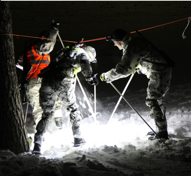
2.-3.3. hiihdettyyn Oltermannihiihtoon osallistui Rannikkoprikaatin partio Espoon seudun kulttuurisäätiö oli yksi varusmiehiä palkinneista kumppaneista kotiutuskahveilla 16.3.