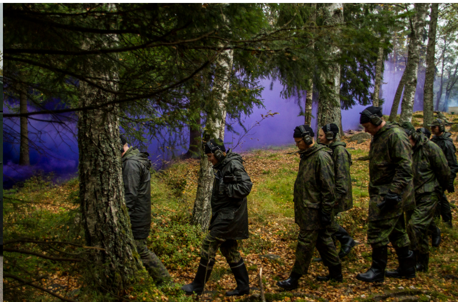
218. valtakunnallisen maanpuolustuskurssin internaattijakso järjestettiin Upinniemessä 27.-29.9.

Puolustusministeri Jussi Niinistö tutustui prikaatin toimintaan 10.10. Meritiedustelupataljoona organisoi näyttävän taistelunäytöksen ministerille.