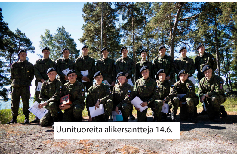
Uunituoreita alikersantteja 14.6.