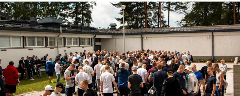
Alla kuva sotilasrippikoulun konfirmaatiosta 9.8. varuskuntakirkko Merikappelissa