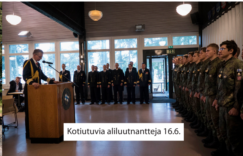
Kotiutuvia aliluutnantteja 16.6.